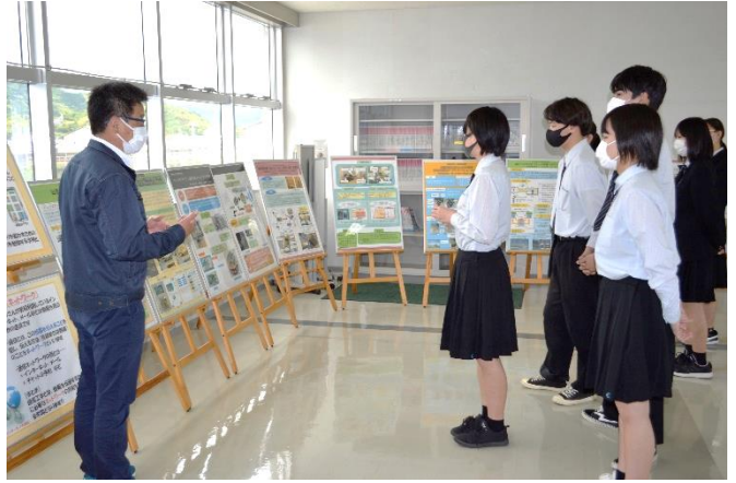
パネルを使用した総合制作の内容説明