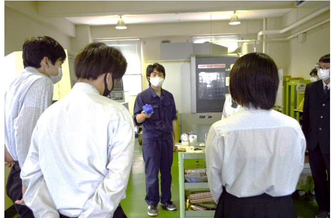
NC加工室にて生産技術科の先生から説明を受ける