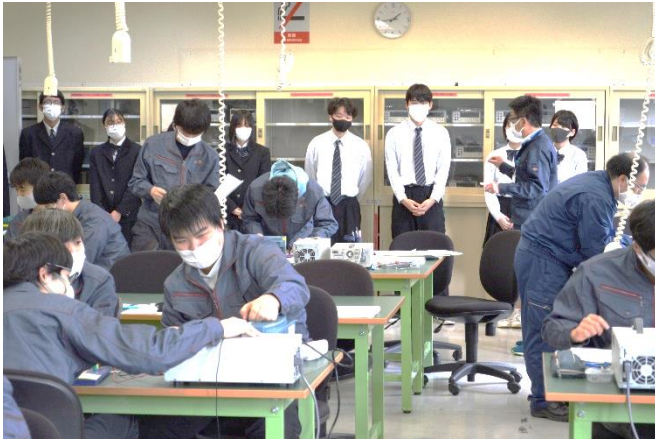
電子情報技術科の授業見学