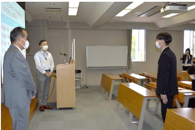
生徒さんよりお礼の言葉をいただいた