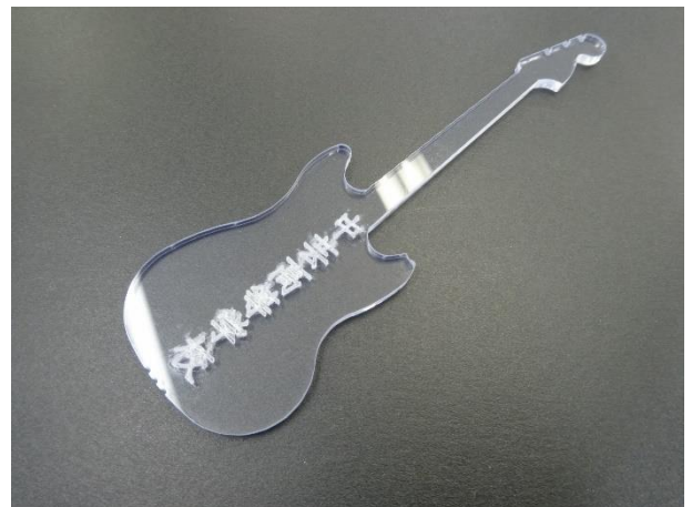
レーザー加工機で校名入りオリジナルアクセサリを実演加工