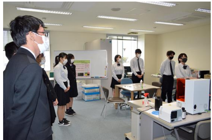
アルコール濃度観測・通知システムの体験 工場・作業現場内でのアルコール濃度を検知し、濃度に応じた警告通知を行ったり、アルコール濃度予測が行えるシステム。