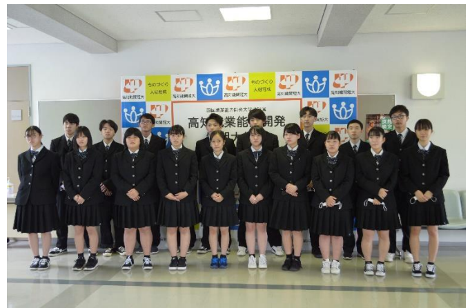
最後にみなさんと写真撮影