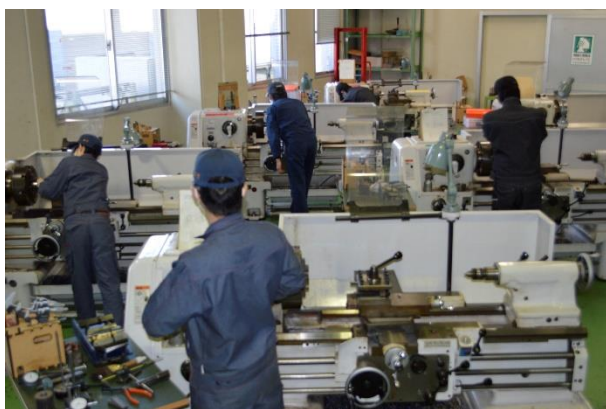
黙々と練習しています。

国家技能検定 機械加工(普通旋盤作業2級)に生産技術科1年生から2名、2年生から2名の計4名が挑戦しました。放課後に何度も集まり、練習をしていました。これで実技試験の対策はバッチリ！ 本番の感想を聞くと、「練習の時よりも速くできた」や「まずまずの出来」との声が返ってきました。3月19日の合格発表が楽しみです。