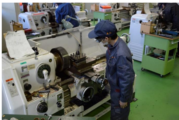
安全に、丁寧に、スピーディーに1つ1つの作業を行います。