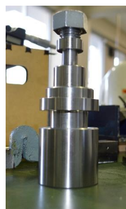
製作物。上手にできました！