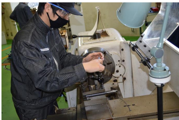
真剣な眼差しで検査をしています。