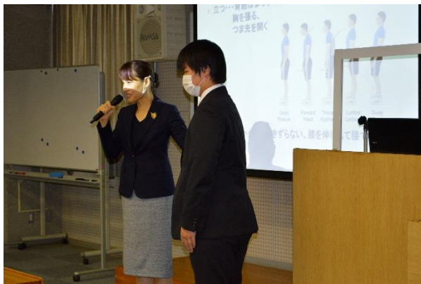
上手くできた学生は、前に出て実演します。