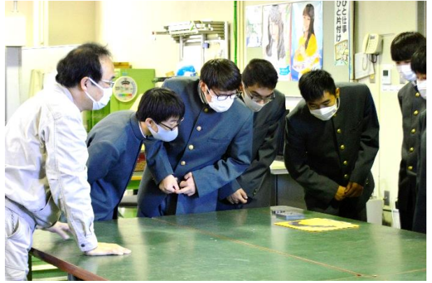
どんなことができる？どんなものをつくる？NC加工室で実際に機器や製作物を見てもらいます。