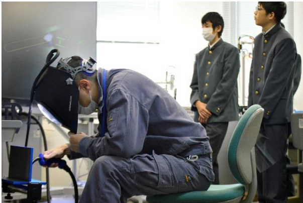
溶接シミュレータ(実在する風景にバーチャルの視覚情報を重ねて表示する[AR])。ゲーム感覚で溶接を学べます。