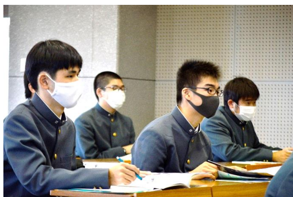
まずはスライドで学校の特徴をご説明。資料を見ながら熱心に聞いてくれています。