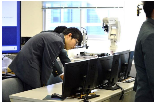
現代の設計の多くはパソコンで。3Dモデルの画面を熱心に見ています。