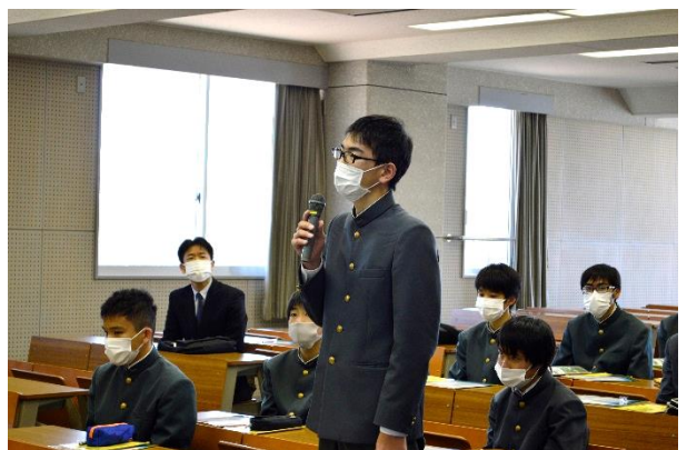
おつかれさまでした。生徒代表からお礼の言葉をいただきました。