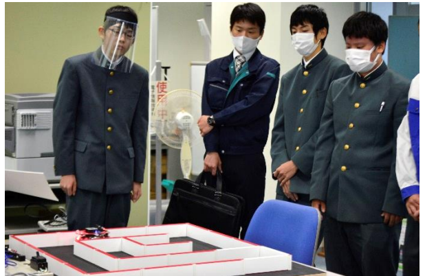
こちらも総合制作の「マイクロマウス」。自走ロボットが迷路を攻略します。