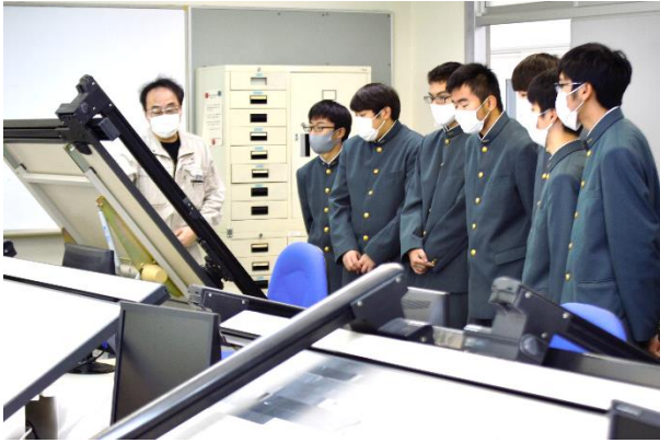
生産技術科 製図室。1年生では手書きで製図の基本ルールを学びます。