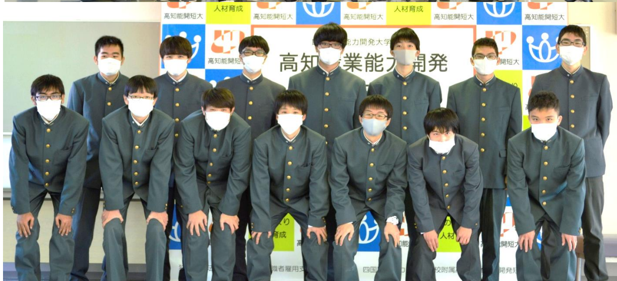
電子機械科(上)と電子科(下)の皆さんが見学に来てくれました。