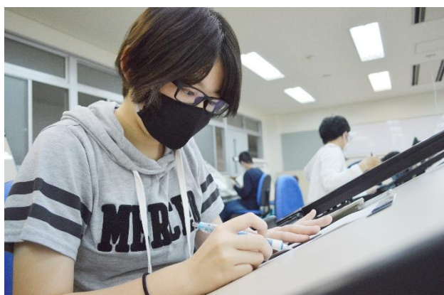
1年生の「基礎製図」。ドラフタを使って手書きで図面を引き、製図の基本を学びます。