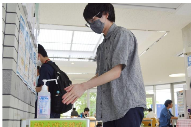
ランチタイム。手指の消毒も忘れずに。新しい生活様式を実践しながらの学校生活です。