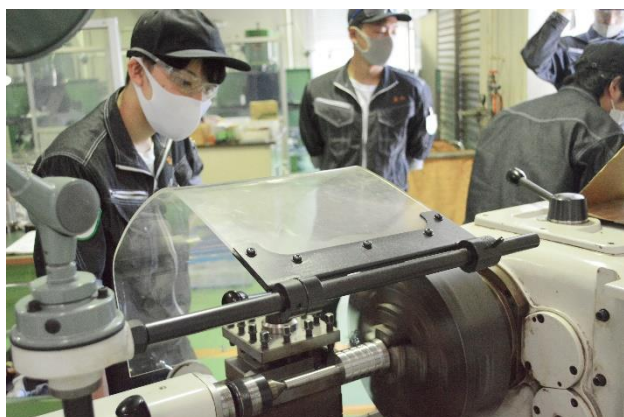
2年生の「機械加工実験」。旋盤やフライス盤を使用し切削加工技術の応用を学びます。