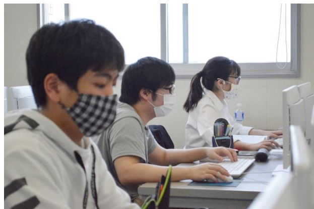
教室は窓を開け、しっかりと換気します。