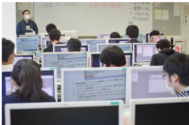
待ちに待った授業再開。

学生たちは大変ですが、しっかりと技能・技術を身に付けられるよう支援していますのでみんなで一緒に頑張りましょう！