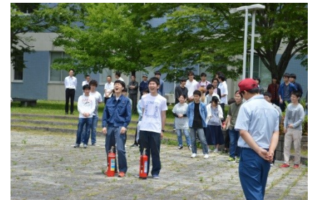
最後に2年生も復習を兼ねて2名が消火に参加。「火事だー！！」