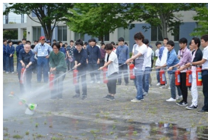
消火器を使って消火中！！上手く消火できたかな