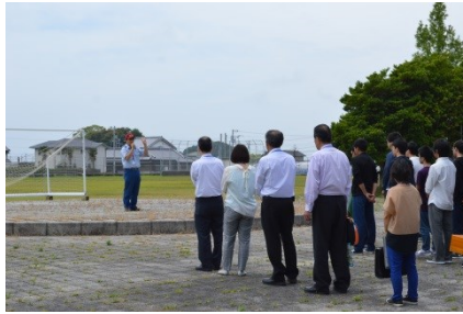
避難についての話を真剣に聞きます