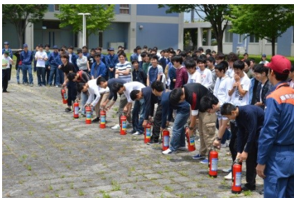
「火事だー」と大声を上げ、すぐ消火器を手にします