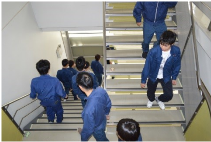
避難訓練スタート