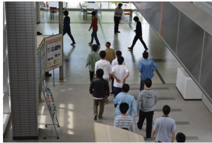
走らず、慌てず避難