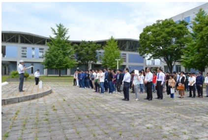
避難について校長からの講評