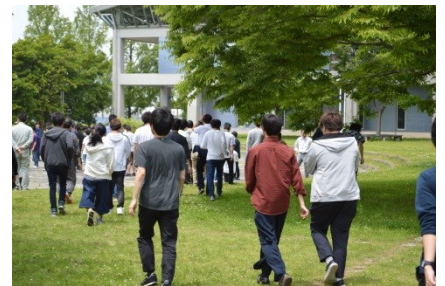
避難先の学生広場へ向かいます