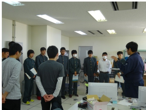
総合制作実習の現状報告 Part2