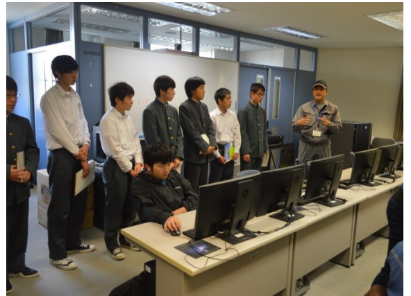
生産技術科の授業風景の見学