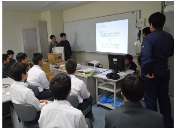
電子情報技術科の総合制作実習の現状報告