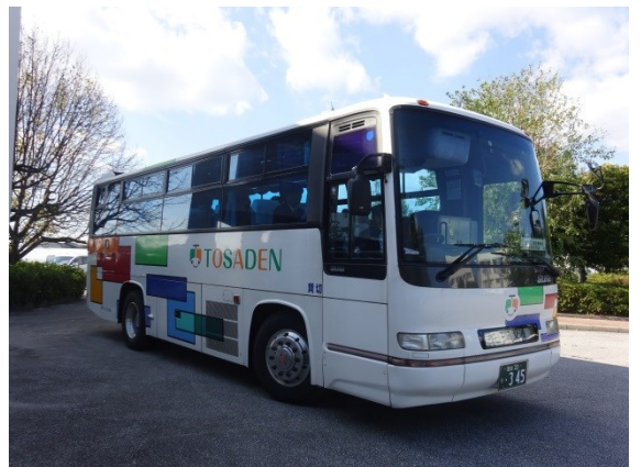
短い時間でしたが、お疲れ様でした。バスで帰路につきました。