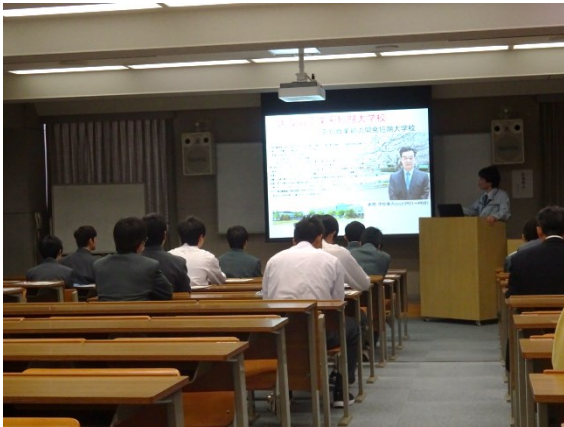
学務援助課長からの挨拶の後、学校の詳しい説明などがありました。

11月16日(木)、県立高知東工業高等学校の電子科2年生23名の生徒さんがキャリアアップ事業の一環として本校を見学されました。学校説明の後、生産技術科ではMCレーザー加工機などの実習室や授業風景を見学し、電子情報技術科では学生による総合制作実習のテーマについての現状報告を聞きました。見学中には色々な質問もあり、当校への興味を感じられる場面もありました。