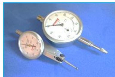
代表製品のダイヤルゲージ