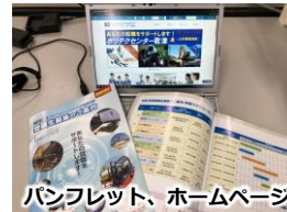
パンフレット、ホームページ