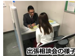
出張相談会の様子