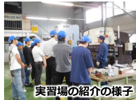
実習場の紹介の様子