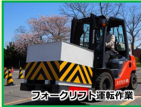
フォークリフト運転作業