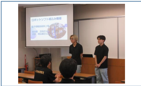
ロボットソフト組み職種