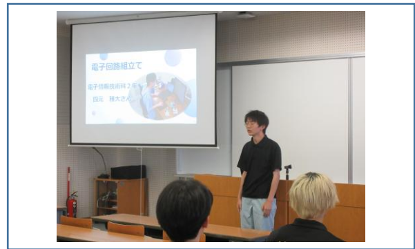
電子回路組立て職種