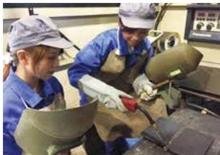
炭酸ガスアーク溶接