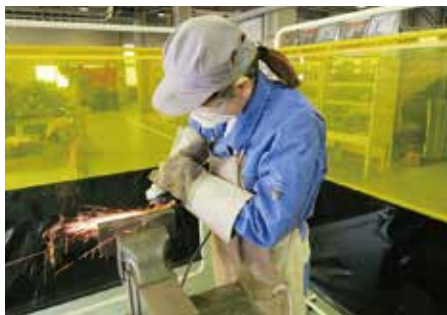
製図・特別教育・技能講習

建設産業・電気産業・自動車産業など、 幅広く日本の基盤産業を支える溶接・精密板金技術を基礎から 習得し、【ものづくり】の世界への再就職につなげます。