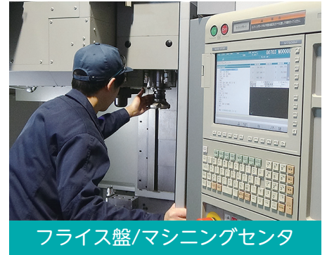
フライス盤/マシニングセンタ