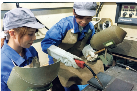
炭酸ガスアーク溶接作業