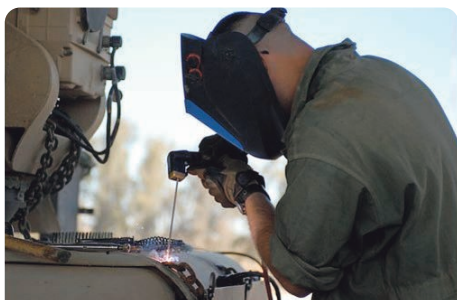
被覆アーク溶接作業