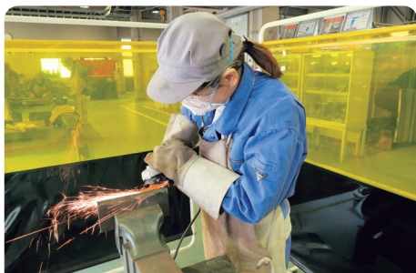
金属加工基本作業

建設産業・電気産業・自動車産業など、幅広く日本の基盤産業を支える溶接・精密板金技術を基礎から習得し、【ものづくり】の世界への再就職につなげます。