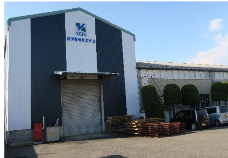
香川県高松市の本社工場