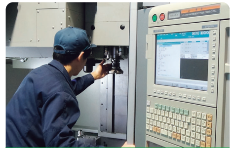
フライス盤／マシニングセンタ