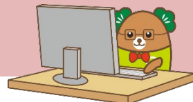
生産性訓練キャラクター「まつお」

表計算ソフトの活用方法を習得するコースです 各コース、先着順で受け付けていますので、お早めにお申し込みください