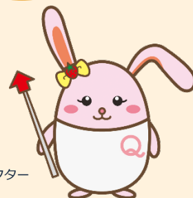
生産性訓練キャラクター 「うさみ」