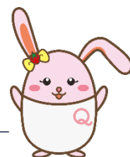
生産性訓練キャラクター 「うさみ」