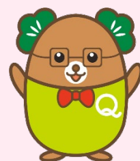
生産性訓練キャラクター 「まつお」