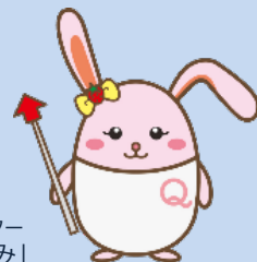
生産性訓練キャラクター 「うさみ」