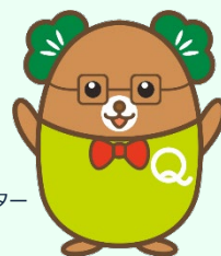
生産性訓練キャラクター 「まつお」