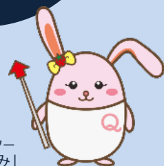
生産性訓練キャラクター 「うさみ」