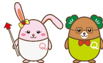
生産性訓練キャラクター 「うさみ」 「まつお」