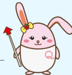
生産性訓練キャラクター 「うさみ」