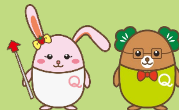
生産性訓練キャラクター 「うさみ」 「まつお」