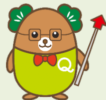
生産性訓練キャラクター 「まつお」