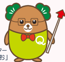
生産性訓練キャラクター 「まつお」