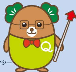
生産性訓練キャラクター 「まつお」