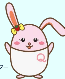
生産性訓練キャラクター 「うさみ」