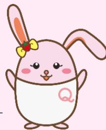
生産性訓練キャラクター 「うさみ」