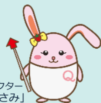
生産性訓練キャラクター 「うさみ」