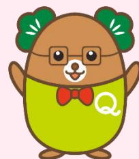
生産性訓練キャラクター 「まつお」