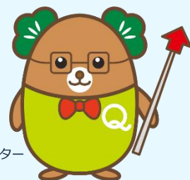
生産性訓練キャラクター 「まっお」