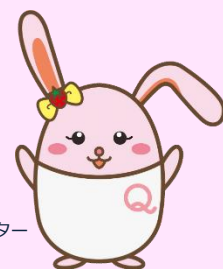
生産性訓練キャラクター 「うさみ」