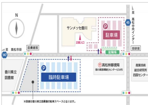
※西側は香川県立図書館の駐車スペースとなります。