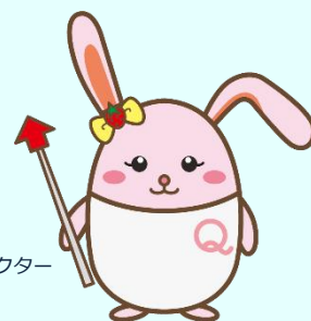
生産性訓練キャラクター 「うさみ」