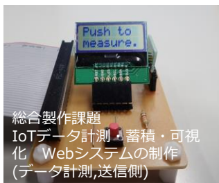
総合製作課題 IoTデータ計測・蓄積・可視化 Webシステムの制作 (データ計測,送信側)

実習では、企業で行う実務に近い内容を体験する事が出来ました。基礎から応用まで学ぶ事ができ、分からないところは理解出来るまで、先生方が教えてくださいました。