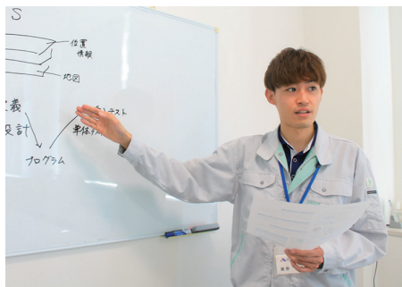
お客様への対面説明や打合せにも参加しています

最近、AI が気になっています。今まで開発してきたシステムにプラスで AI を組み込んだらどうなるのか等…様々な可能性を感じています。新しいシステム開発にも興味がありますが、AI をつかって「何をするか」が大事なので、ただ作るだけではなくニーズを調査して実用的な企画開発をしたいです。これからもお客様の困りごとを解決していきたいです。