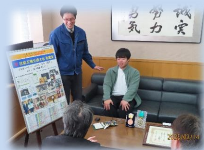
東先生からの入賞報告