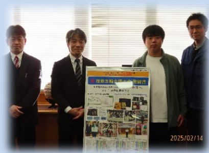
先生方と記念撮影