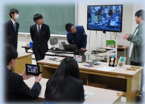
大会動画を使っでの説明