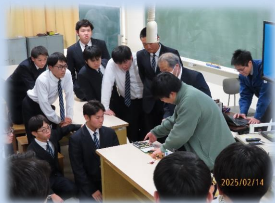
母校の後輩や先生方は 大変熱心に聞いてくださいました