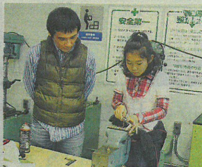
万力やハンダごての使い方もすぐになじんだ女の子たち