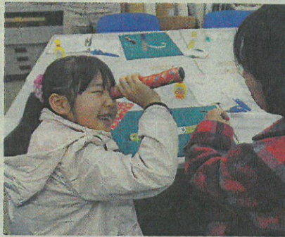
今までとは違う万華鏡やソーラーカーづくりを楽しんだ