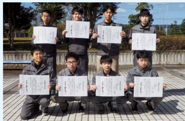
合格記念写真(令和元年前期)