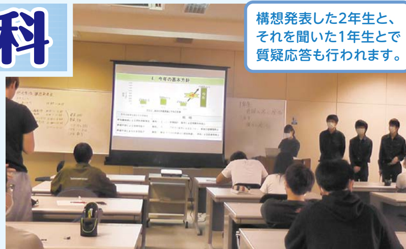
総合制作実習構想発表会の様子

「総合制作実習」とは、当校2年次に取り組む実技科目のことです。生産技術科では、機械装置や車両など制作テーマをグループごとに決めて、自分たちで作るための計画・設計・製作・評価・発表(まとめ)について各グループで取り組みます。毎年1月に開催する「ポリテックビジョン穴水」という発表会までに完成させることが共通の目標です。やるべきことは盛りだくさんですが、学生たちはこの実習に一番やりがいを感じているようです。