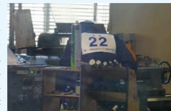
前年度若年者ものづくり競技大会競技風景(旋盤)

57回目となる技能五輪全国大会は愛知県にて開催を予定しており、当校からも出場を予定しております。前年度は出場者がいませんでしたが、今年度はCAD作業に1名挑戦を予定しており、大会に向け練習を続けています。放課後などは競技会以外の自主練習も認めており、普通高校出身の学生も競技会選手に交じって練習に励んでいます。