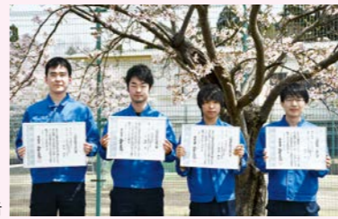
シーケンス制御3級合格者

平成30年12月に技能検定電気機器組立て(シーケンス制御)を受験し、3級4名の学生が合格しました。その他、第一種電気工事士に1名、第二種電気工事士(下期)に4名合格しました。更に自主学習により、基本情報処理技術者試験に1名合格しました。