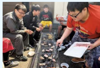
バーベキュー風景

これから2年間、穴水の地で技術・技能を大いに養い、ものづくり産業を支える実践技能者として成長してくれることを大いに期待しています。