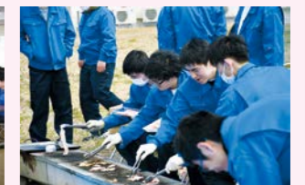
バーベキュー大会