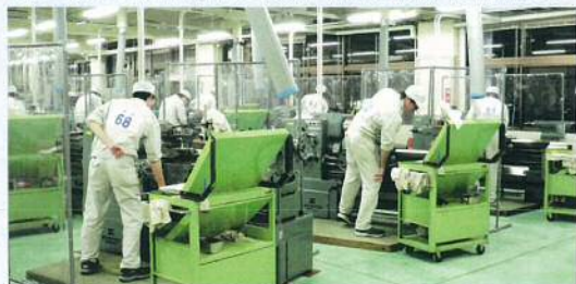
「技能検定練習の風景」

今年も、学生たちが自分の技能・技術をかけて挑戦する「技能検定前期試験」の時期が来ました。今年も8名の学生が挑戦します。普通旋盤加工、NC旋盤など様々な試験にチャレンジします。これから試験日まで、自分たちの技能・技術を磨くために練習に練習を重ねて挑みます。合格目指して頑張れ、未来の技能・技術者たち!!