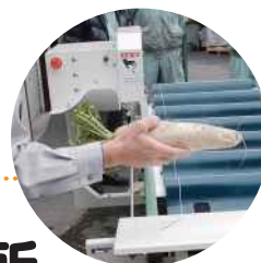
←ダイコン菜切り機