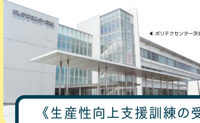
ポリテクセンター茨城