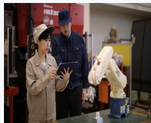
▲ 小型ロボットアームの制御実習