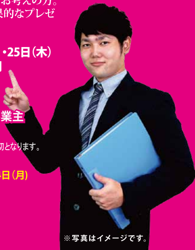
※ 写真はイメージです。