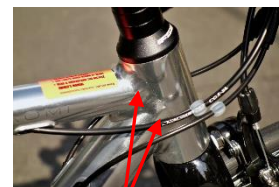
自転車のフレームよく見ると溶接されていることがわかりますよ

このように私たちの身の周りの製品、皆さんが住んでいる家や建物から自動車や電車、船、ロケットに至るまで、さまざまなモノが溶接技術で成り立っているのです。溶接はモノづくりになくてはならない技術ですので、未経験の方でも溶接の基本をしっかりと学べば誰もが溶接の仕事で働くことができます。まさに一生もののスキルに！！