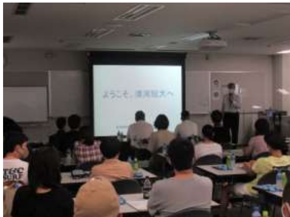
校長の歓迎のあいさつ