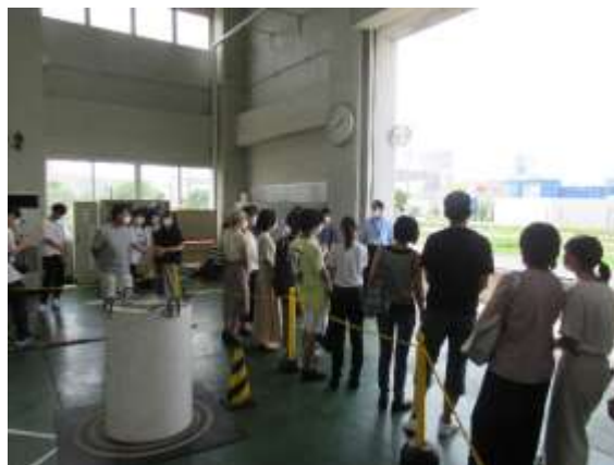
港湾技術科・実習場の見学 ～港湾の現場管理技術者を 目指すコースです！～