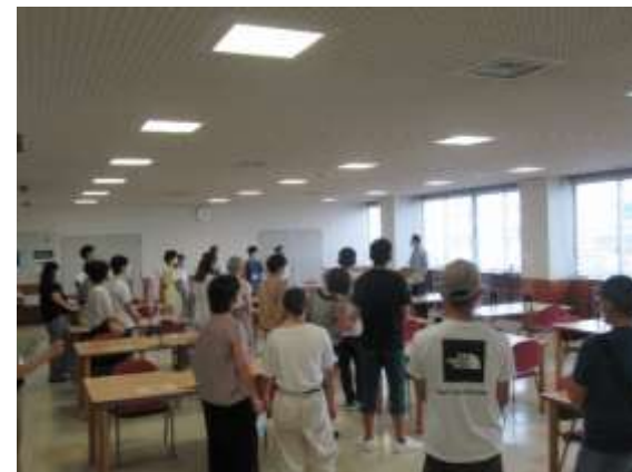
学生ホールの見学 ～神戸港の景色が展望できます！～