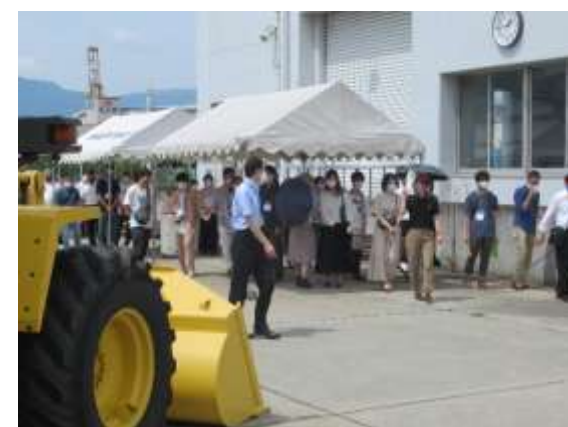
屋外実習場の見学 ～一堂に揃えられた物流荷役車両 はまるで展示会場！ 圧巻！～