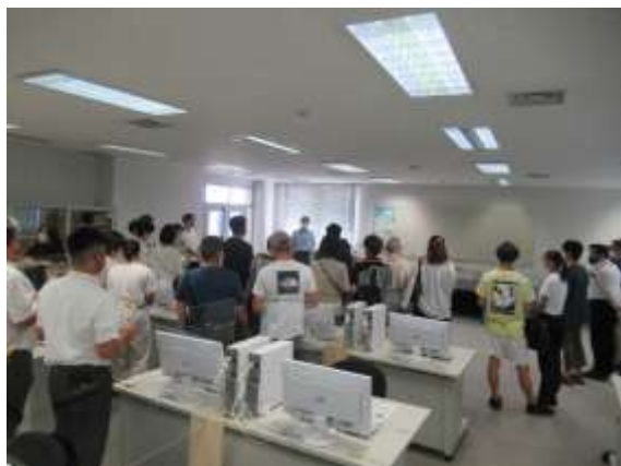
港湾流通科・教室の見学 ～貿易事務のスペシャリストを 目指すコースです！～