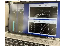
● 監視用ソフトウェア