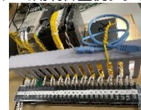
● 遠方監視装置端末